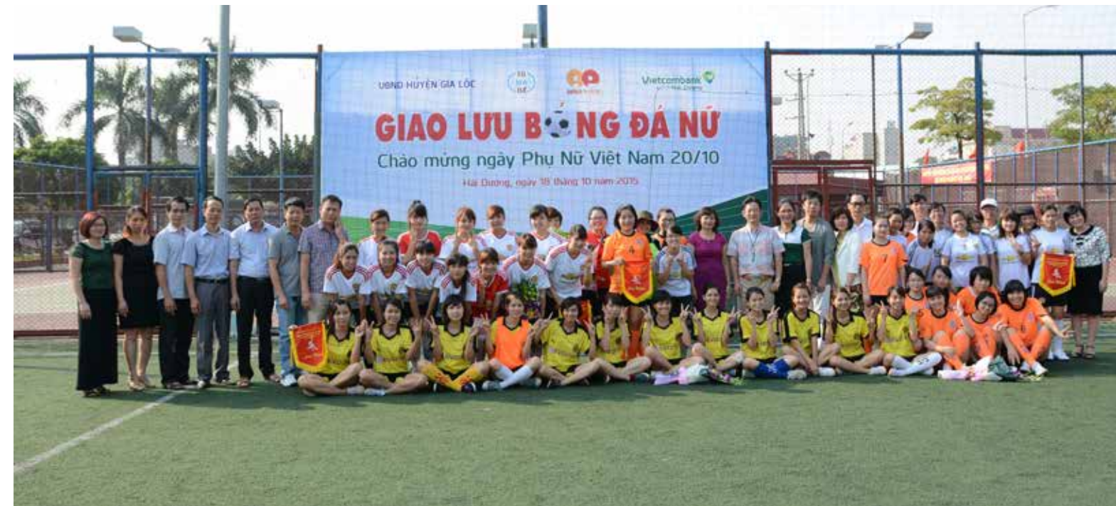
Giao lưu bóng đá nữ giữa 4 đơn vị

Hội thao đã giúp cán bộ nhân viên rèn luyện sức khỏe để nâng cao hiệu quả trong công việc, đồng thời giao lưu, học hỏi kinh nghiệm với các cơ sở đoàn, qua đó góp phần quảng bá hình ảnh thương hiệu Vietcombank đến với các doanh nghiệp và khách hàng trên địa bàn. □