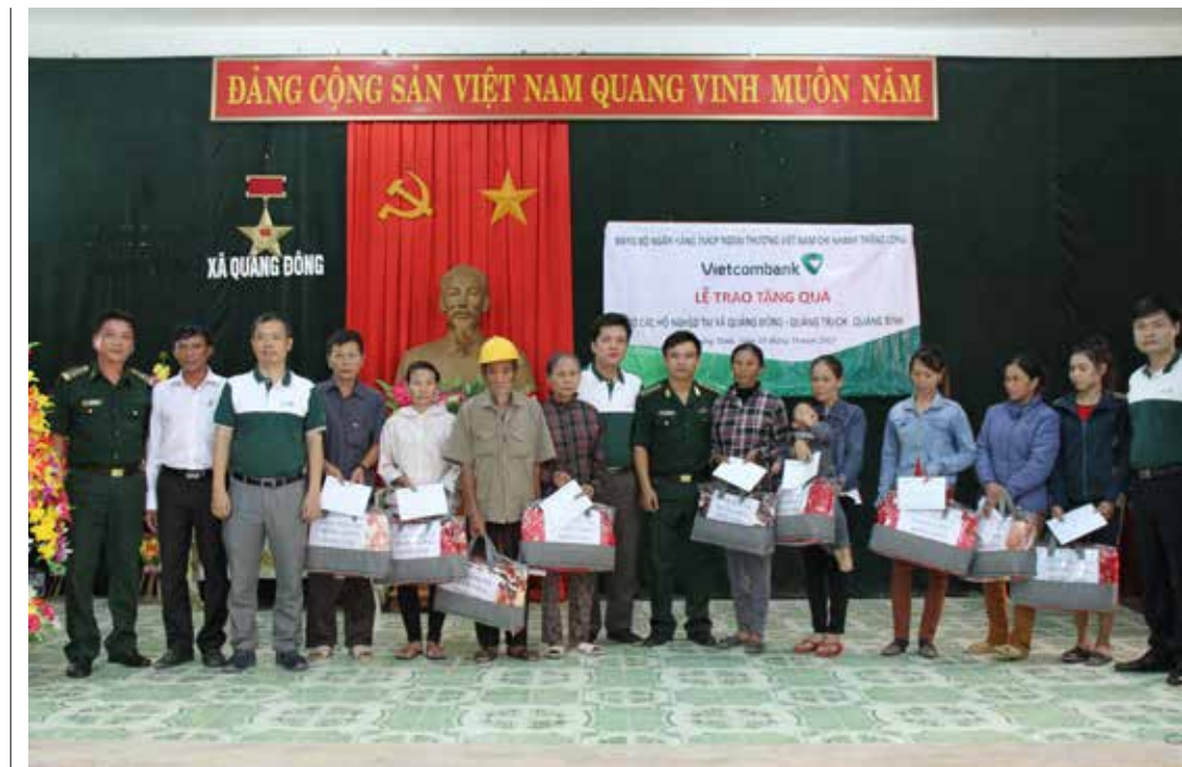
Đại diện Đảng ủy, Ban giám đốc Vietcombank Thăng Long tặng quà cho các hộ nghèo xã Quảng Đông

Tạm biệt Vũng Chùa, Đảo Yến đoàn chúng tôi lên đường về xã Quảng Đông, huyện Quảng Trạch, Quảng Bình. Xã Quảng Đông là một xã nghèo, thuần nông, người dân sống chủ yếu dựa vào nông nghiệp độc canh lúa nước nhưng lại là nơi hứng chịu nhiều thiên tai trong mùa mưa bão. Thu nhập bình quân đầu người rất thấp, chỉ 6.000.000 đồng/người/năm nên đời sống nhân dân gặp rất nhiều khó khăn. Với 10 suất quà trị giá bằng tiền mặt là 500.000 đồng cùng 10