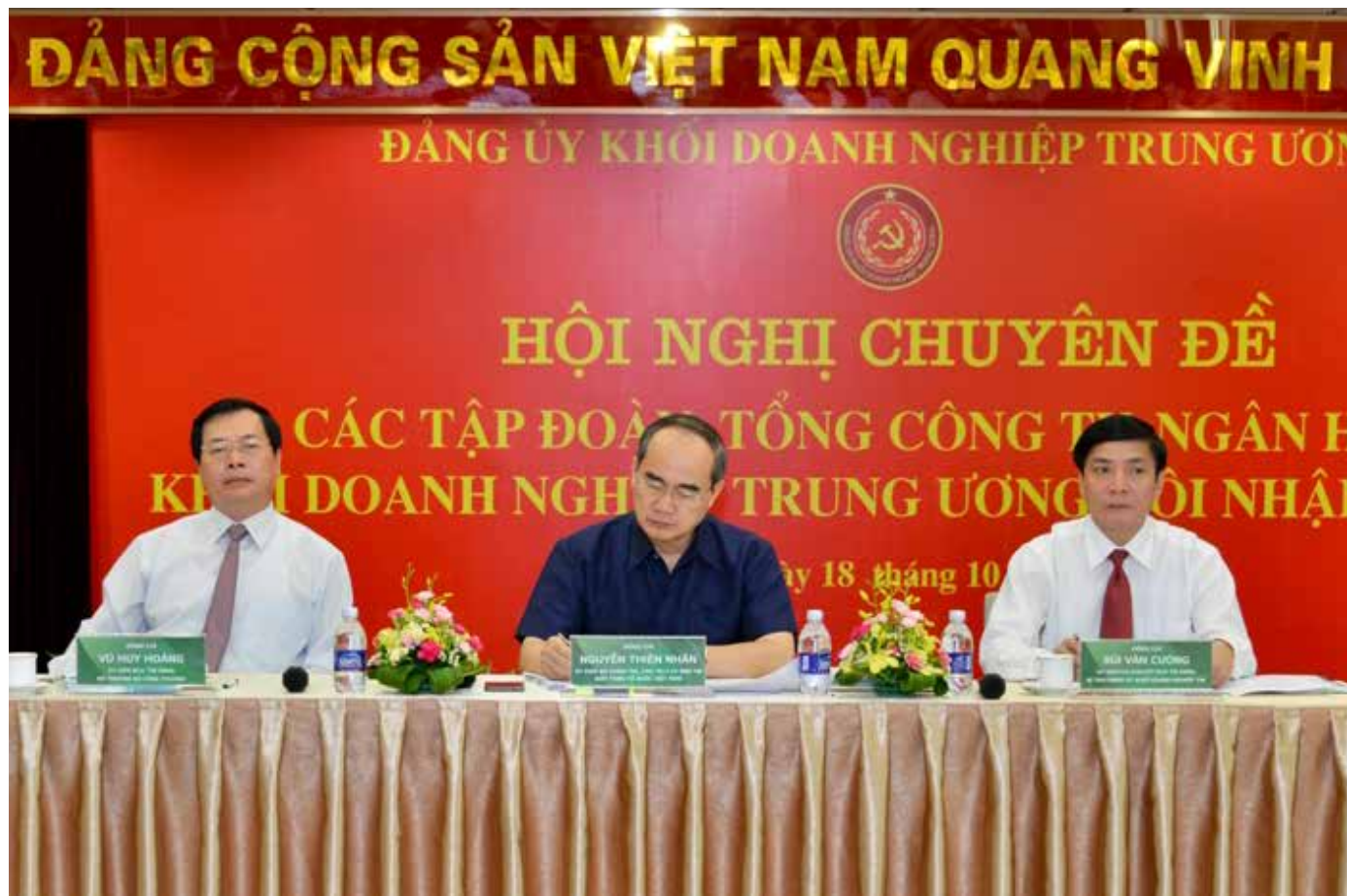
Đoàn Chủ tịch điều hành Hội nghị