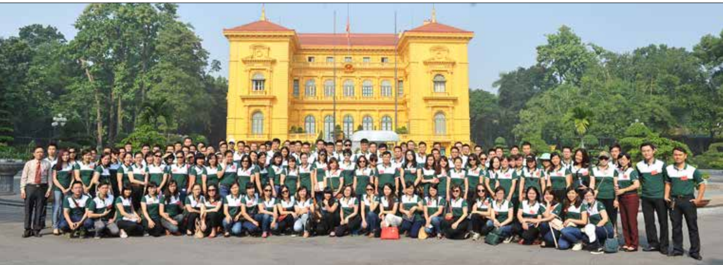
Lớp học chụp ảnh lưu niệm sau khi tham quan Phủ Chủ tịch