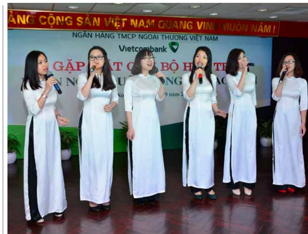
Các cán bộ Vietcombank biểu diễn văn nghệ chào mừng các cán bộ hưu trí nhân ngày Quốc tế người cao tuổi