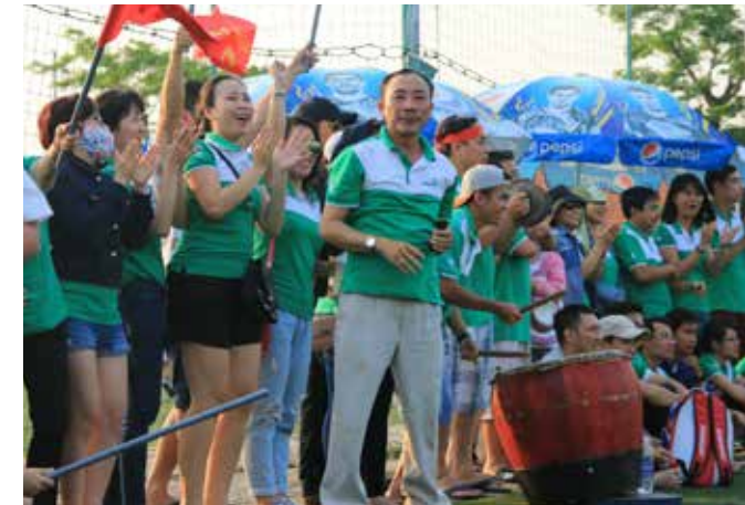
Tinh thần cổ động viên