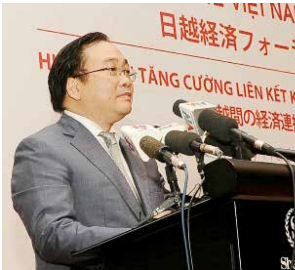
Phó Thủ tướng Hoàng Trung Hải phát biểu tại Diễn đàn