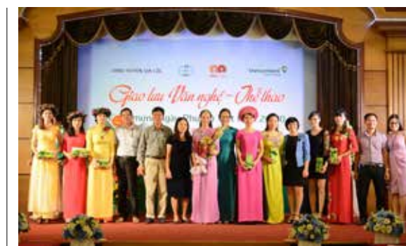
Hội thi Duyên dáng Việt Nam chào mừng ngày 20/10 tại Vietcombank Hải Dương

T trong không khí vui tươi phấn khởi của phụ nữ toàn quốc chào mừng kỷ niệm 85 năm Ngày thành lập Hội Liên hiệp Phụ nữ Việt Nam; 5 năm kỷ niệm Ngày Phụ nữ Việt Nam 20 - 10, Công đoàn Vietcombank Hải Dương đã tổ chức nhiều hoạt động giao lưu diễn ra sôi nổi và đầy ấn tượng, tiêu biểu là Giải bóng đá nữ mở rộng giữa 4 đơn vị: UBND huyện Gia Lộc, Công ty TNHH Điện tử Towada Việt Nam, Công ty CP Nhựa và Môi trường xanh An Phát và Vietcombank Hải Dương. Đây là một hoạt động truyền thống diễn ra hàng năm nhằm đẩy mạnh phong trào thể dục thể thao, đồng thời là cơ hội để các bạn nữ nói riêng và toàn thể các cán bộ nhân viên giữa 4