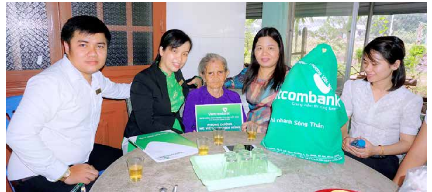
BCH Công đoàn – Đoàn thanh niên Vietcombank Sóng Thần thăm Mẹ Việt Nam Anh hùng