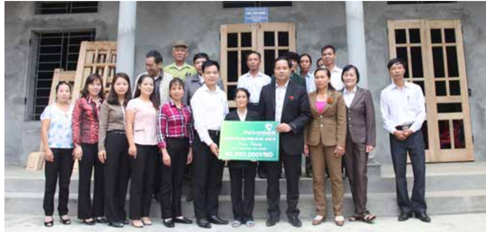
Đại diện Vietcombank Việt Trì bàn giao nhà tình nghĩa cho hộ nghèo tại xã Ninh Dân, Thanh Ba, Phú Thọ