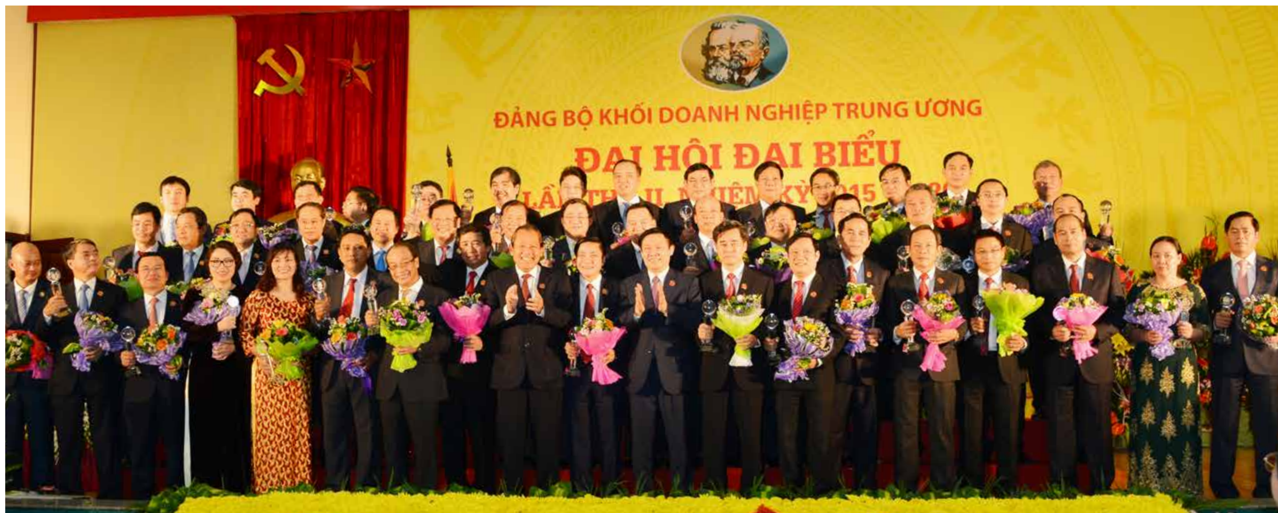
Đ/c Trương Hòa Bình - Bí thư Trung ương Đảng - Chánh án Tòa án Nhân dân Tối cao (hàng đầu, thứ 9 từ trái sang) và đ/c Vương Đình Huệ - Ủy viên BCH TW Đảng - Trưởng ban Kinh tế Trung ương (hàng đầu, thứ 11 từ trái sang) tặng hoa chúc mừng các đ/c Ủy viên BCH Đảng bộ Khối DNTW nhiệm kỳ 2015 - 2020 ra mắt tại Đại hội