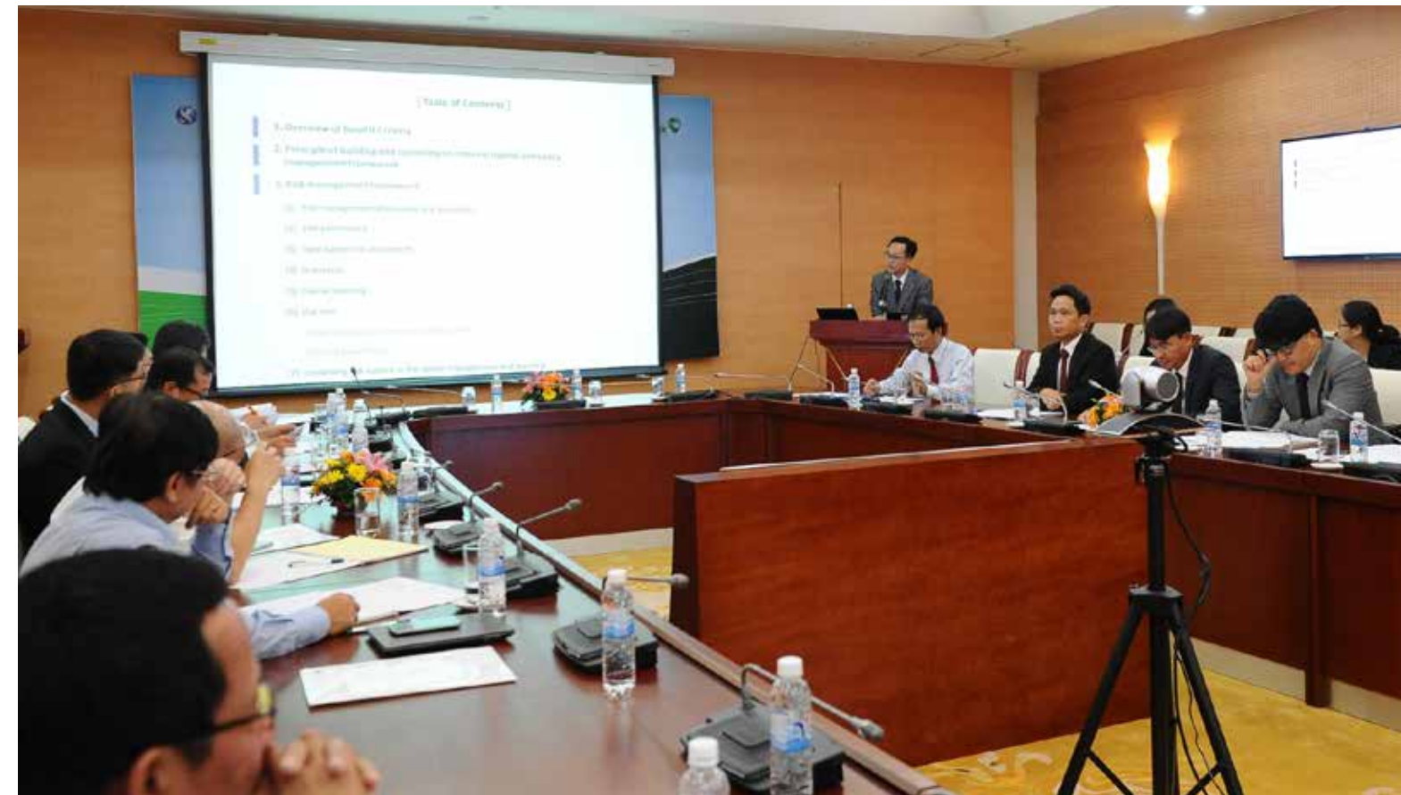
Toàn cảnh Hội thảo Quản lý vốn và hệ thống dữ liệu rủi ro theo Basel II

việc trong thời gian tới theo kế hoạch, lộ trình đề ra, NHNN và các NHTM cần vượt qua thách thức trong quá trình triển khai thực hiện Basel II xuất phát từ những khó khăn do: khuôn khổ pháp lý liên quan (kế toán, tài sản đảm bảo...) chưa đồng bộ; Các thị trường chính thức chưa phát triển đầy đủ; Nguồn nhân lực và năng lực tài chính của các TCTD còn hạn chế; Bộ máy quản lý rủi ro hoạt động chưa thực sự hiệu quả; Cơ sở dữ liệu, hệ thống công nghệ thông tin chưa đáp ứng được các yêu cầu quản lý theo Basel II. Để làm được điều này, NHNN sẽ tiếp tục ưu tiên thực hiện các giải pháp hỗ trợ các NHTM, nhất là 10 NHTM được lựa chọn thí điểm triển khai Basel II, trong đó hoạt động chia sẻ kinh nghiệm về triển khai Basel II với các ngân hàng nước ngoài sẽ được chú trọng triển khai