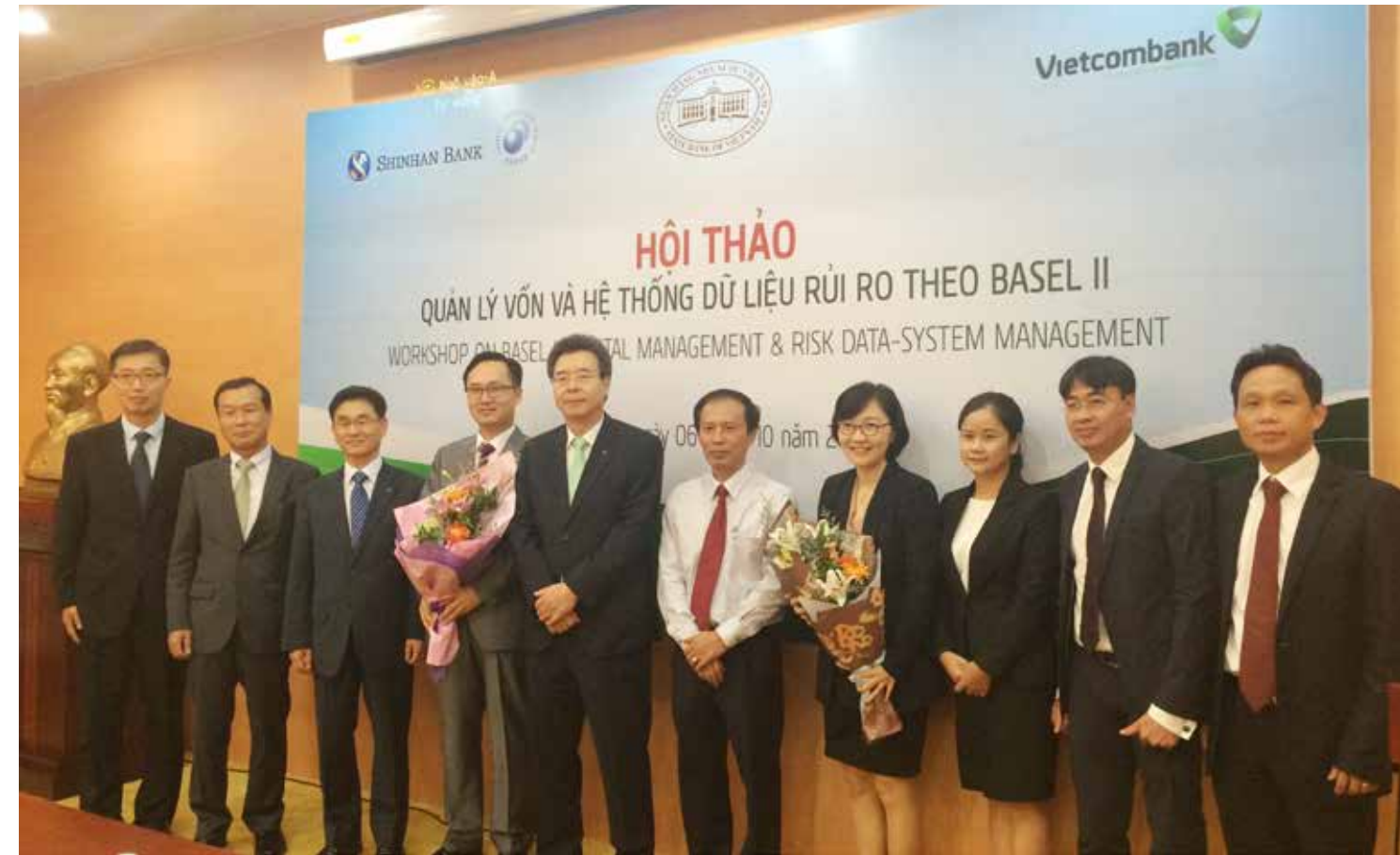
Các đại biểu chụp hình lưu niệm tại Hội thảo

Việt Nam có truyền thống trên 50 năm hoạt động. Ban Lãnh đạo Vietcombank đã đề ra chiến lược phát triển là đến năm 2020 sẽ trở thành ngân hàng số 1 tại Việt Nam và là ngân hàng quản trị rủi ro tốt nhất. Chính vì thế, Vietcombank đã chủ động và tích cực triển khai khi được chọn là 1 trong 10 ngân hàng đầu tiên tại Việt Nam áp dụng Hiệp ước Basel II.