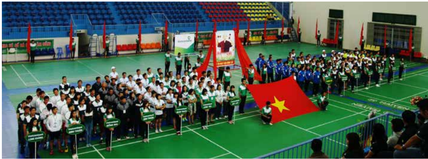
Lễ Khai mạc Hội thao Vietcombank khu vực V