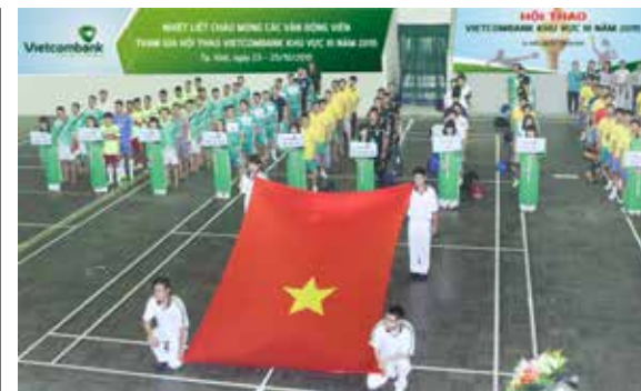
Quang cảnh lễ khai mạc hội thao Vietcombank khu vực III năm 2015.

Có thể nói rằng, Hội thao khu vực III năm 2015 là một giải đấu với chất lượng chuyên môn cao, để lại nhiều kỷ niệm và thắt chặt tình đoàn kết giữa các CBNV trong hệ thống Vietcombank. □