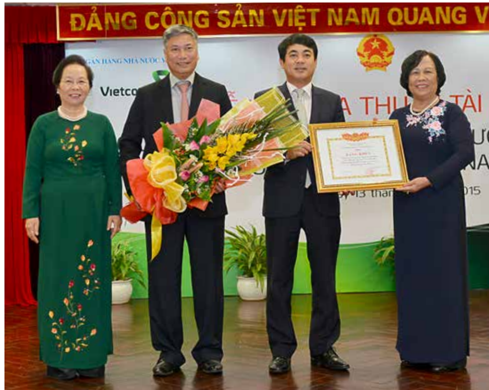
Bà Nguyễn Thị Doan - Phó Chủ tịch nước CH XHCN Việt Nam (ngoài cùng bên trái) và bà Phạm Thị Hải Chuyền - Bộ trưởng Bộ Lao động TBXH trao Bằng khen và tặng hoa cho tập thể Vietcombank với thành tích xuất sắc trong công tác bảo vệ và chăm sóc trẻ em

Ngày 13/10/2015, tại thành phố Hà Nội, đã diễn ra Lễ ký kết thỏa thuận tài trợ và nhận tài trợ giữa Ngân hàng TMCP Ngoại thương Việt Nam (Vietcombank) và Quỹ Bảo trợ trẻ em Việt Nam (Quỹ BTTEVN). Tham dự buổi lễ có bà Nguyễn Thị Doan - Ủy viên BCH TW Đảng, Phó Chủ tịch nước CH XHCN Việt Nam, Chủ tịch Hội đồng Bảo trợ Quỹ BTTE VN. Về phía Bộ Lao động Thương binh & Xã hội có bà Phạm Thị Hải Chuyền - Ủy viên BCH TW Đảng, Bộ trưởng, Phó Chủ tịch Hội đồng Bảo trợ Quỹ