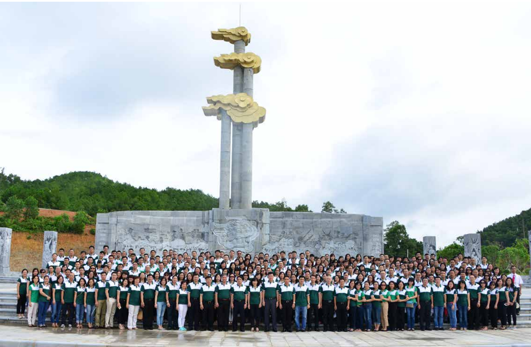
Đoàn đại biểu Đảng bộ HSC tại Trường Bản - Nghệ An

đã báo công dâng Bác về những thành tích Vietcombank đã đạt được trong thời gian qua và hứa với Bác các đảng viên Hội sở chính Vietcombank cũng như toàn bộ gần 14 nghìn cán bộ Vietcombank toàn hệ thống sẽ tiếp tục đồng lòng xây dựng một tập thể đoàn kết, phấn đấu hoàn thành tốt các nhiệm vụ kinh doanh đã đề ra hướng đến