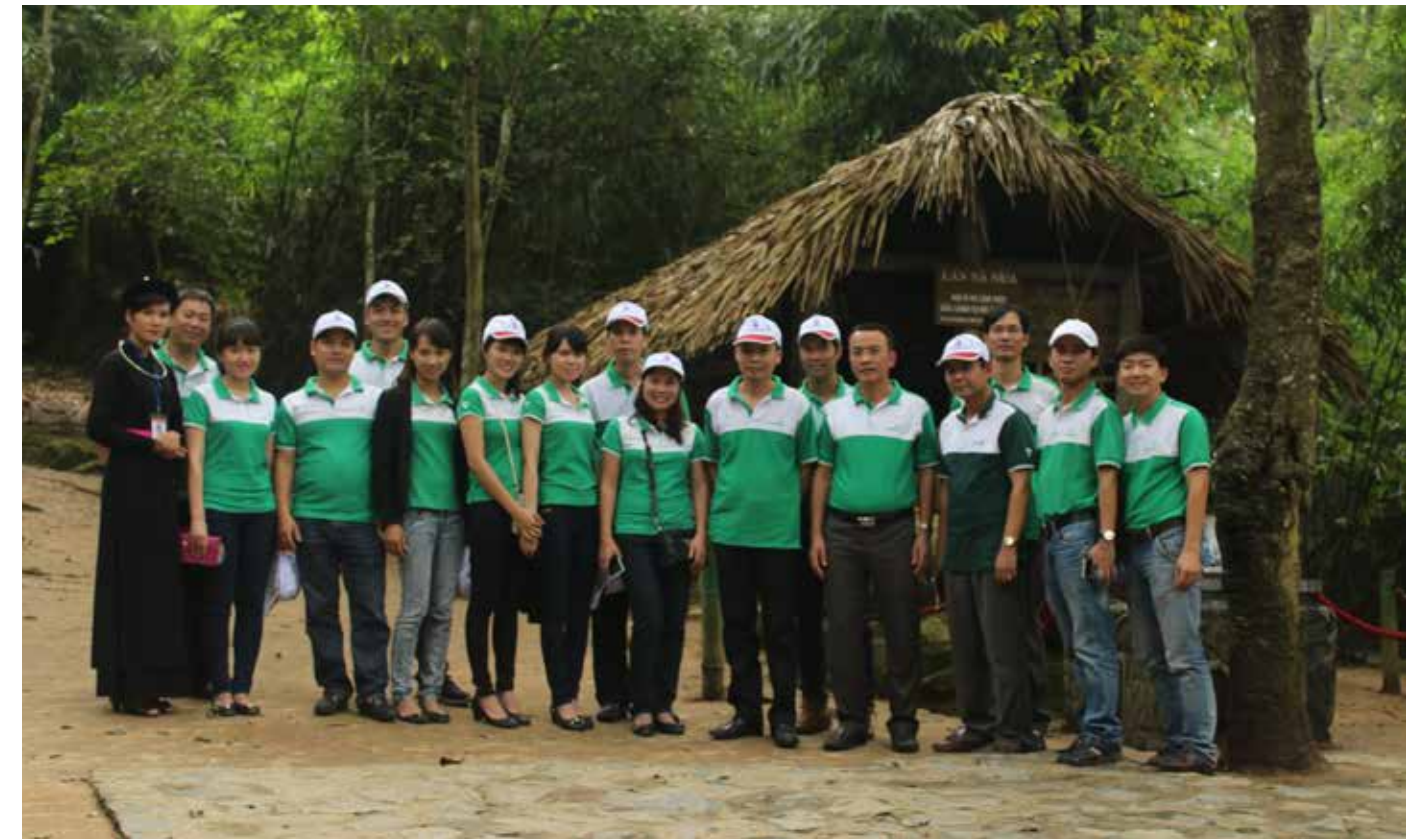
Vietcombank Nam Định thăm di tích lán Nà Nưa

Sơn. Các trận đấu đã diễn ra sôi nổi với sự nhiệt tình của cả các cầu thủ và các cổ động viên giúp giải đấu kết thúc tốt đẹp với giải Nhất thuộc về Vietcombank Móng Cái. Sau giải đấu, Vietcombank Lạng Sơn đã tổ chức chương trình giao lưu Văn nghệ tôn vinh các cán bộ nữ của Vietcombank nhân kỷ niệm Ngày Phụ nữ Việt Nam 20 - 10. Đây là hoạt động vô cùng ý nghĩa, bên cạnh việc giao lưu trao đổi nghiệp vụ và tạo sự gắn bó, nâng cao quảng bá hình ảnh thương hiệu Vietcombank trên địa bàn tỉnh Lạng Sơn. □