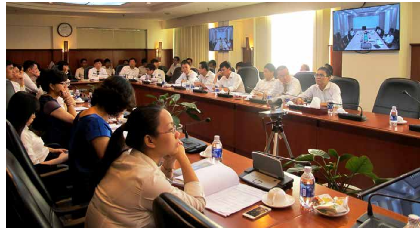
Toàn cảnh Hội nghị tại đầu cầu Trụ sở chính

Theo chương trình hội nghị, các đại biểu sẽ được các chuyên gia của Cục Quản lý hoạt động xây dựng - Bộ Xây dựng và Viện kinh tế Xây dựng - Bộ Xây dựng giới thiệu về 5 Nghị định liên quan đến công tác XDCB và cuối chương trình tập huấn sẽ có bài test kiểm tra kiến thức. □