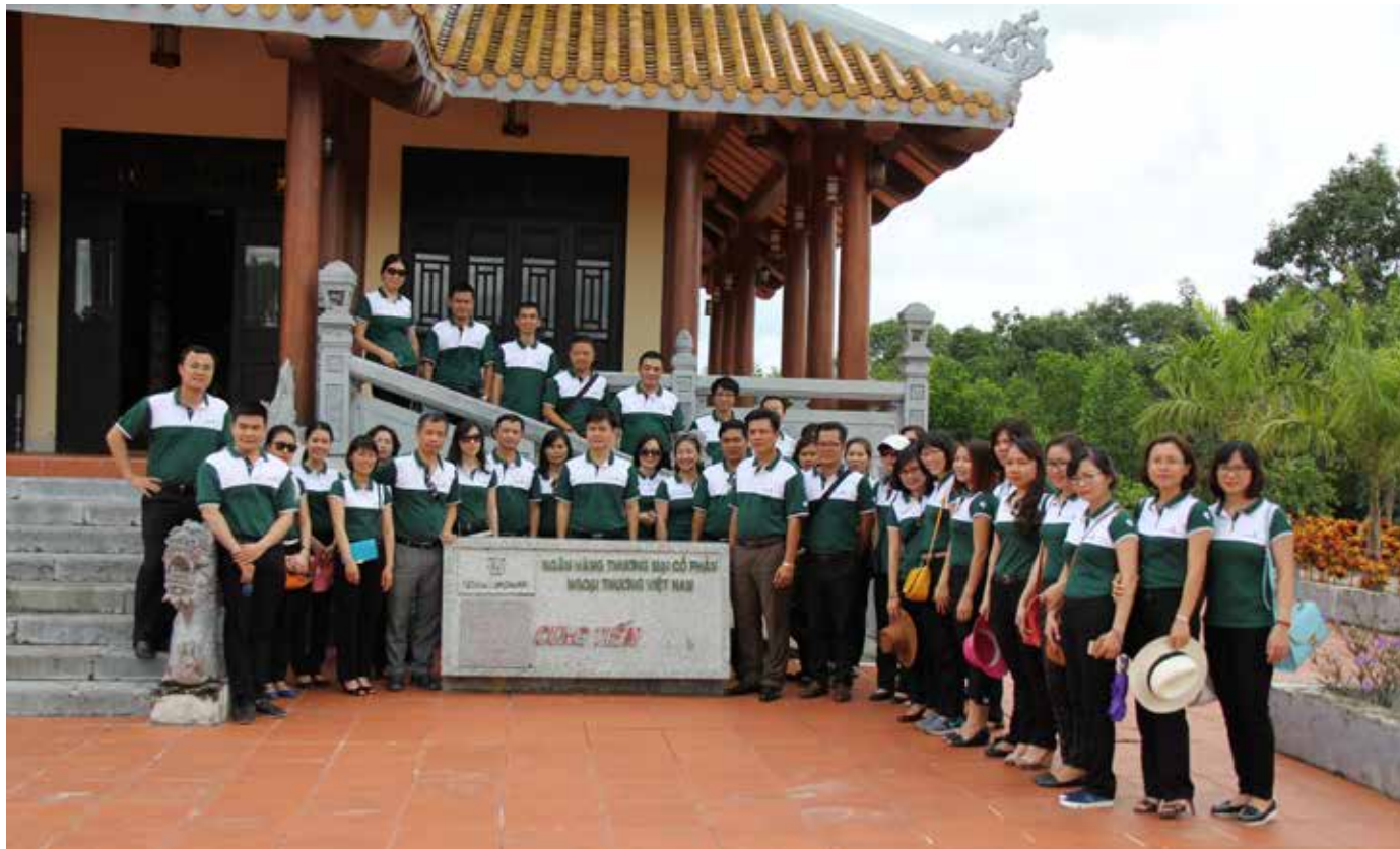
Đoàn đại biểu Đảng bộ Vietcombank Thăng Long chụp ảnh kỷ niệm tại Đền Tưởng niệm liệt sỹ Trường Sơn - Bến Tắt