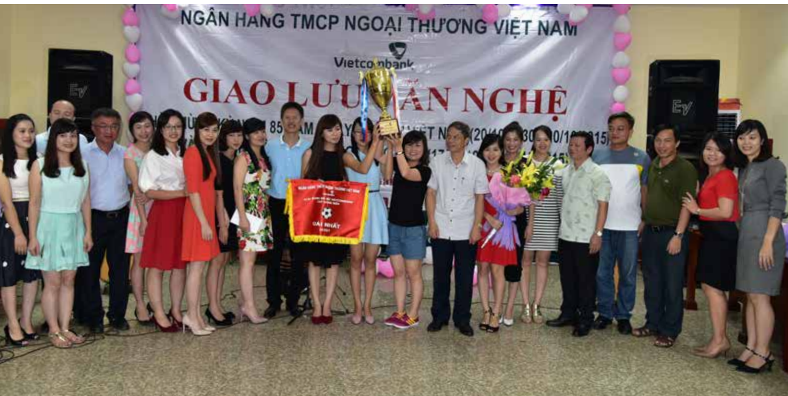
Chương trình giao lưu văn nghệ

ngày 16/8/1945 quân Giải phóng nhân dân Việt Nam làm lễ xuất quân trước sự chứng kiến của 60 đại biểu toàn quốc về dự Quốc dân Đại hội và nhân dân Tân Trào. Đại tướng Võ Nguyên Giáp đã đọc Bản Quân lệnh số 1 và ngay sau đó quân Giải phóng đã lên đường vượt qua Thái Nguyên tiến về giải phóng Hà Nội. Cuộc hành trình về nguồn mang đầy ý nghĩa với mỗi cán bộ đảng viên và đoàn viên, là một hoạt động thường trong việc tuyên truyền giáo dục truyền thống cho các thế hệ cán bộ Vietcombank Nam Định. □