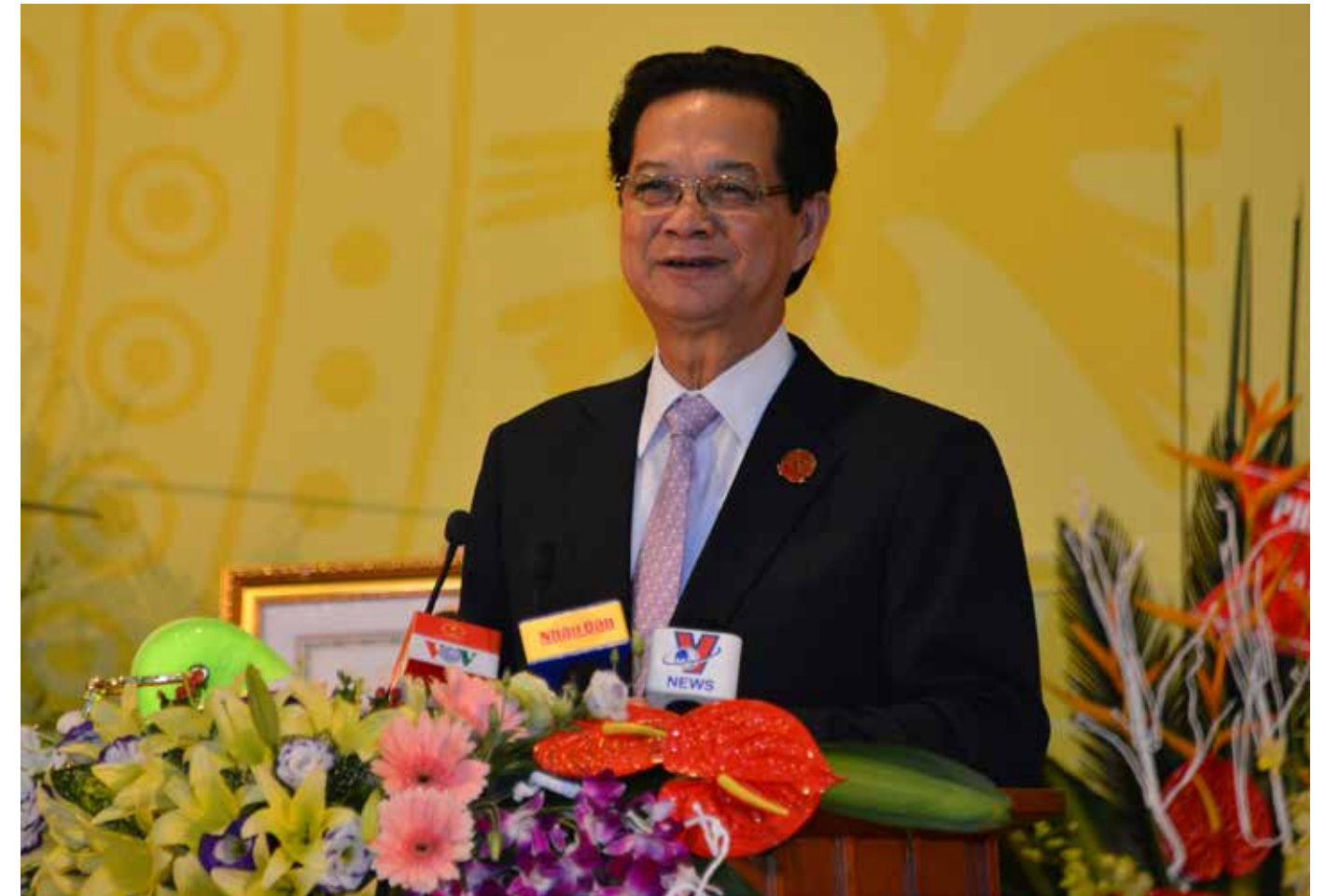
Thủ tướng Chính phủ Nguyễn Tấn Dũng phát biểu chỉ đạo tại Đại hội