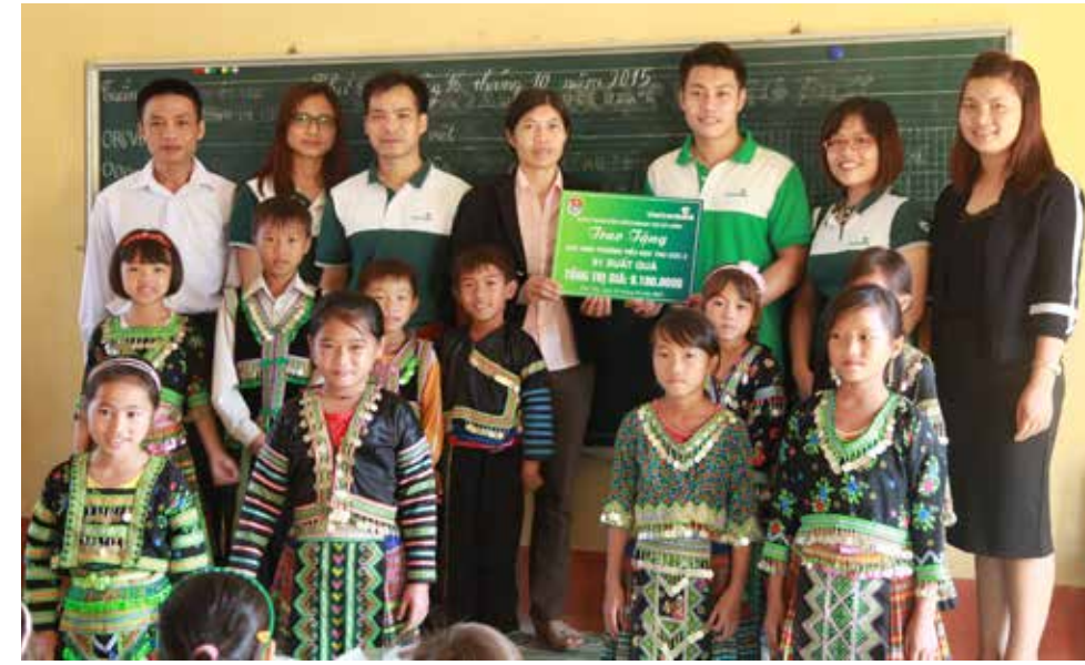
Đoàn chụp ảnh lưu niệm với các thầy cô và các em học sinh Trường Thu Cúc 2 – cơ sở bản Mỹ Á, Tân Sơn, Phú Thọ

Điểm đến đầu tiên của Đoàn là bản Cỏi, xã Xuân Sơn. Nằm sâu trong Vườn quốc gia Xuân Sơn hơn 10km, bản Cỏi có gần 90 hộ dân với phần lớn là đồng bào dân tộc người Dao Tiên, một số ít là dân tộc Mường sinh sống. Tuy là khu bảo tồn quốc gia và có cảnh quan núi rừng rất đẹp với nhiều động khô động ướt, nhưng không vì thế mà cuộc sống của bà con dân tộc thiểu số nơi đây bớt khó khăn. Đến với bản Cỏi, không khó để bắt gặp những em bé lấm lem cạnh những ngôi nhà vách đất mái gianh tạm bợ. Trường Tiểu học Xuân Sơn - điểm trường bản Cỏi bao gồm 51 em học sinh và 5 thầy cô giáo giảng dạy đều là người dân tộc Mường sinh sống tại địa phương.