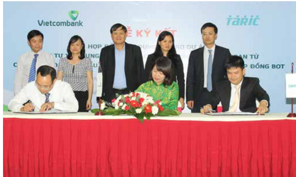
Lễ ký kết Hợp đồng tín dụng trị giá 2.334 tỷ đồng giữa Vietcombank Hà Nội với Công ty Cổ phần Tasco - Nhà đầu tư Dự án và Công ty TNHH MTV Tasco Hải Phòng - Doanh nghiệp dự án

Ngày 15/10/2015, tại Hà Nội, Vietcombank Hà Nội với Công ty Cổ phần Tasco - Nhà đầu tư Dự án và Công ty TNHH MTV Tasco Hải Phòng - Doanh nghiệp dự án đã tổ chức Lễ ký kết Hợp đồng tín dụng tài trợ Dự án Đầu tư nâng cấp cải tạo Quốc lộ 10, đoạn từ Cầu Quán Toan đến Cầu Nghìn TP. Hải Phòng theo hình thức Hợp đồng BOT.