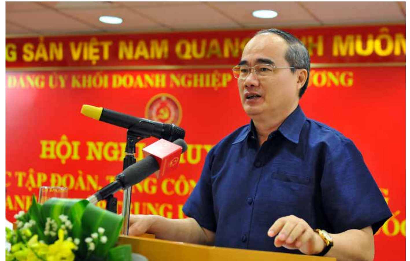
Đồng chí Nguyễn Thiện Nhân - Ủy viên Bộ Chính trị, Chủ tịch UBTW MTTQ Việt Nam phát biểu chỉ đạo Hội nghị