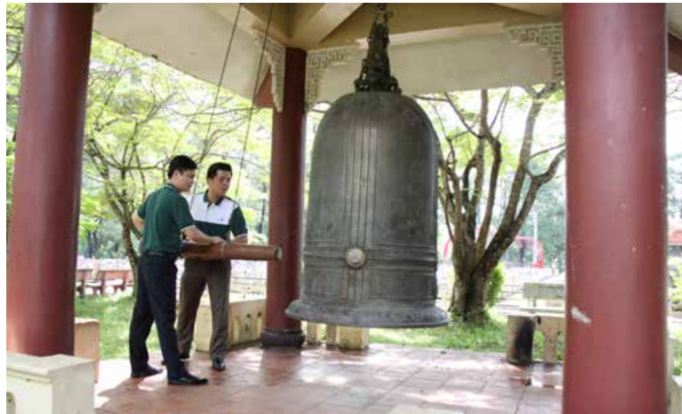
Đồng chí Bí thư (bên phải) và Phó Bí thư Đảng bộ đại diện cho Đoàn thính chuông cầu nguyện

Trở về sau chuyến hành trình về nguồn trong tiết thu tháng 10, tôi và các đồng chí cán bộ đảng viên Vietcombank Thăng Long lại tiếp tục với những công việc thường ngày. Thế nhưng vẫn còn đâu đây vẹn nguyên cảm xúc của chuyến đi viếng mộ Đại tướng Võ Nguyên Giáp, Nghĩa trang Trường Sơn, Bến phà Long Đại, cũng như làm công tác an sinh xã hội tại xã Quảng Đông, Quảng Trạch, Quảng Bình... Nhớ lắm những mảnh đất đã đi qua, ở nơi ấy có những người bác, người chú, người cô, người anh, người chị đã nằm xuống để bảo vệ Tổ quốc, để cho tôi, cho các bạn có cuộc sống ấm no, hạnh phúc như ngày hôm nay.