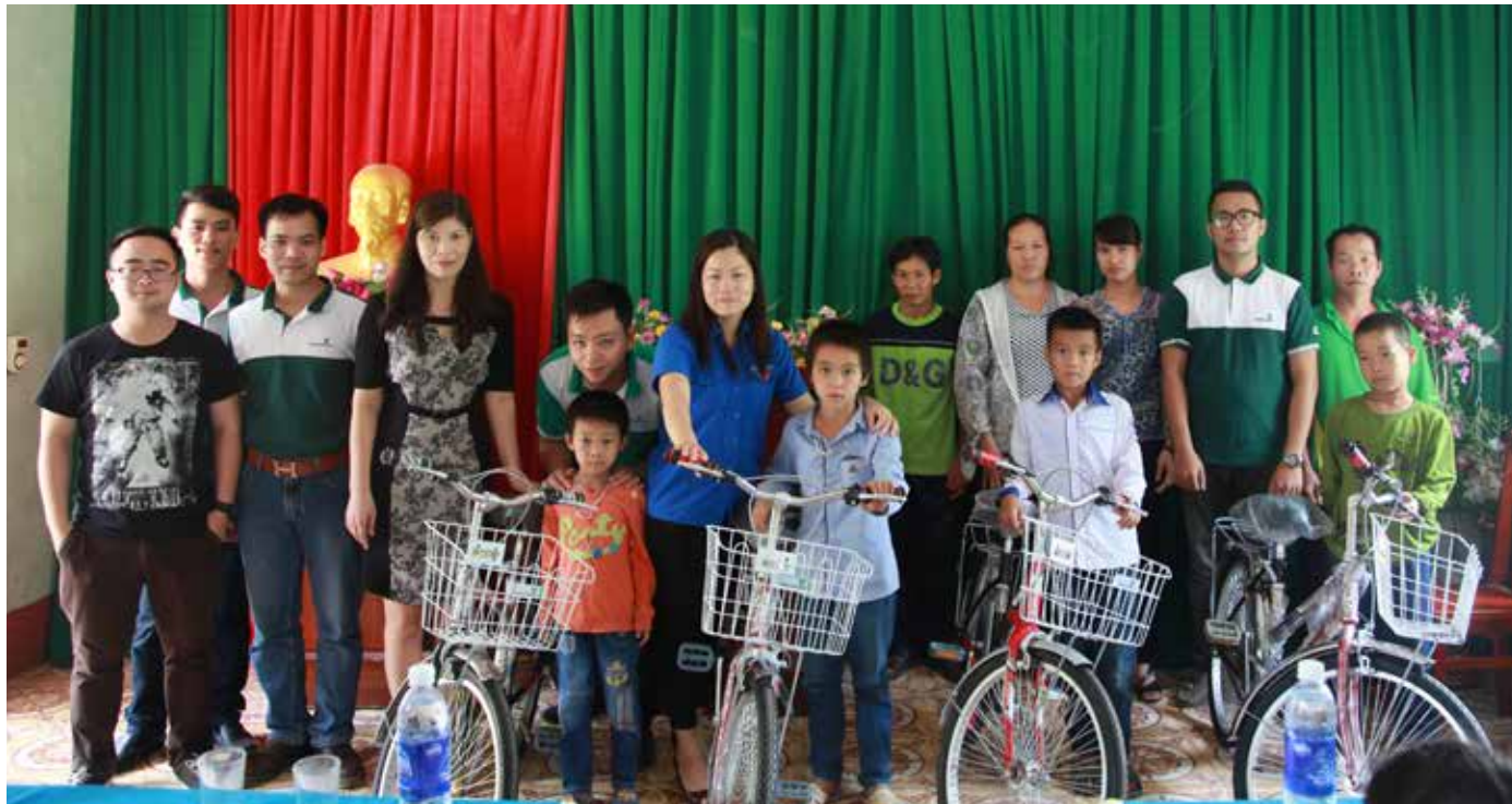
Đoàn chụp ảnh lưu niệm với các thầy cô và các em học sinh Trường Tiểu học Sơn Hùng, Thanh Sơn, Phú Thọ

một số đồ dùng học tập cho nhà trường. Nhìn các em học sinh gầy gò trong trang phục truyền thống người Mông mở từng hộp bút, cuốn vở mới, ánh mắt long lanh chúng tôi cũng thấy lòng thêm ấm áp. Thấm nhủ, chắc chắn sẽ quay lại Mỹ Á một ngày gần nhất.