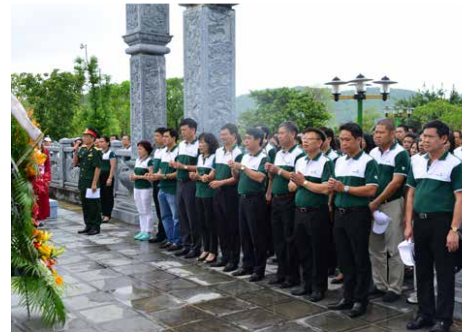
Đoàn dâng hương tưởng niệm các liệt sỹ tại Khu Di tích lịch sử Trường Bản

Vietcombank. Và chuyến đi về nguồn lần này cũng giống như những chuỗi hoạt động thiết thực khác của Vietcombank trong nhiều năm qua không chỉ hướng ứng tinh thần “Uống nước nhớ nguồn” của dân tộc Việt Nam mà còn thật sự mang lại những cảm nhận khó quên cho các đảng viên được tham gia chuyến hành trình. □