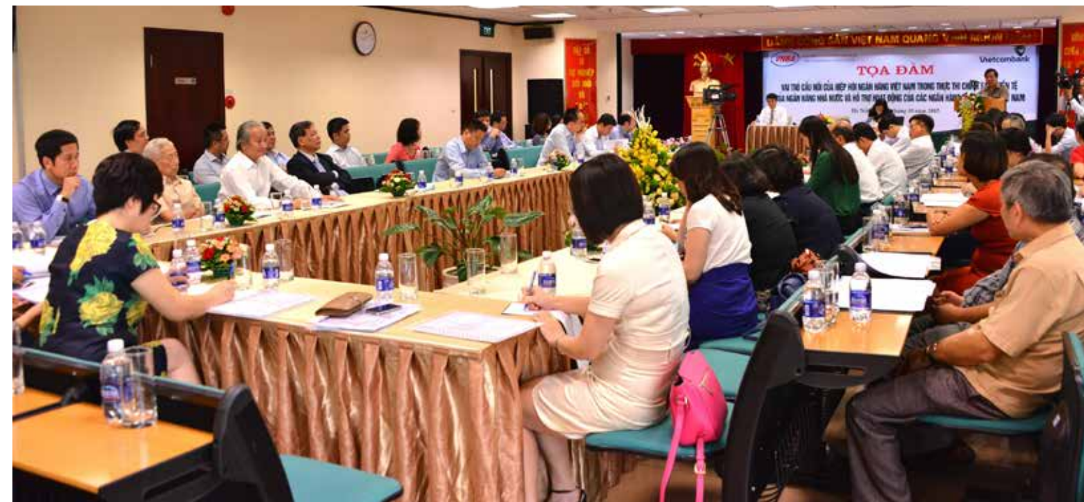
Toàn cảnh buổi Tọa đàm

Sau nửa ngày làm việc với tinh thần khẩn trương, nghiêm túc, lắng nghe và chia sẻ, buổi Tọa đàm đã kết thúc thành công. □