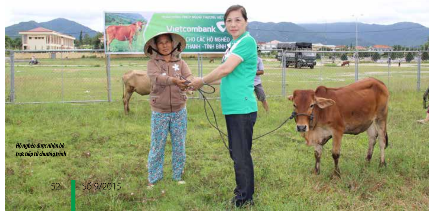
Hộ nghèo được nhận bò trực tiếp từ chương trình

Cũng trong đợt này, cùng với việc được nhận 1 con bò giống trị giá 15 triệu đồng theo chương trình, các hộ nghèo còn được Vietcombank Quy Nhơn trích từ quỹ an sinh xã hội số tiền 50 triệu đồng để tặng mỗi hộ 1 suất quà trị giá 500.000 đồng gồm gạo và tập vở nhằm góp phần ổn định cuộc sống cho bà con. □