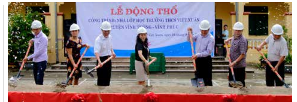
Lễ động thổ xây dựng công trình Nhà lớp học Trường THCS Việt Xuân do Vietcombank tài trợ 3 tỷ đồng

Xã Việt Xuân, huyện Vĩnh Tường là một xã còn nhiều khó khăn trên địa bàn, việc đầu tư đồng bộ cơ sở vật chất cho giáo dục còn nhiều hạn chế, đặc biệt là hệ thống các phòng chức năng và trang thiết bị dạy học ảnh hưởng không nhỏ đến công tác dạy và học của thầy cô và các em học sinh trên địa bàn huyện. Để chung tay, góp sức cùng địa phương, Vietcombank đã tiến hành tài trợ xây dựng công trình