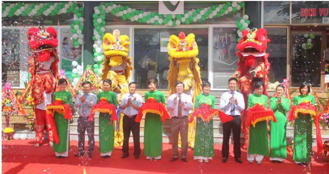
Các đại biểu cắt băng khai trương Phòng giao dịch Đông Hà thuộc Vietcombank Quảng Trị