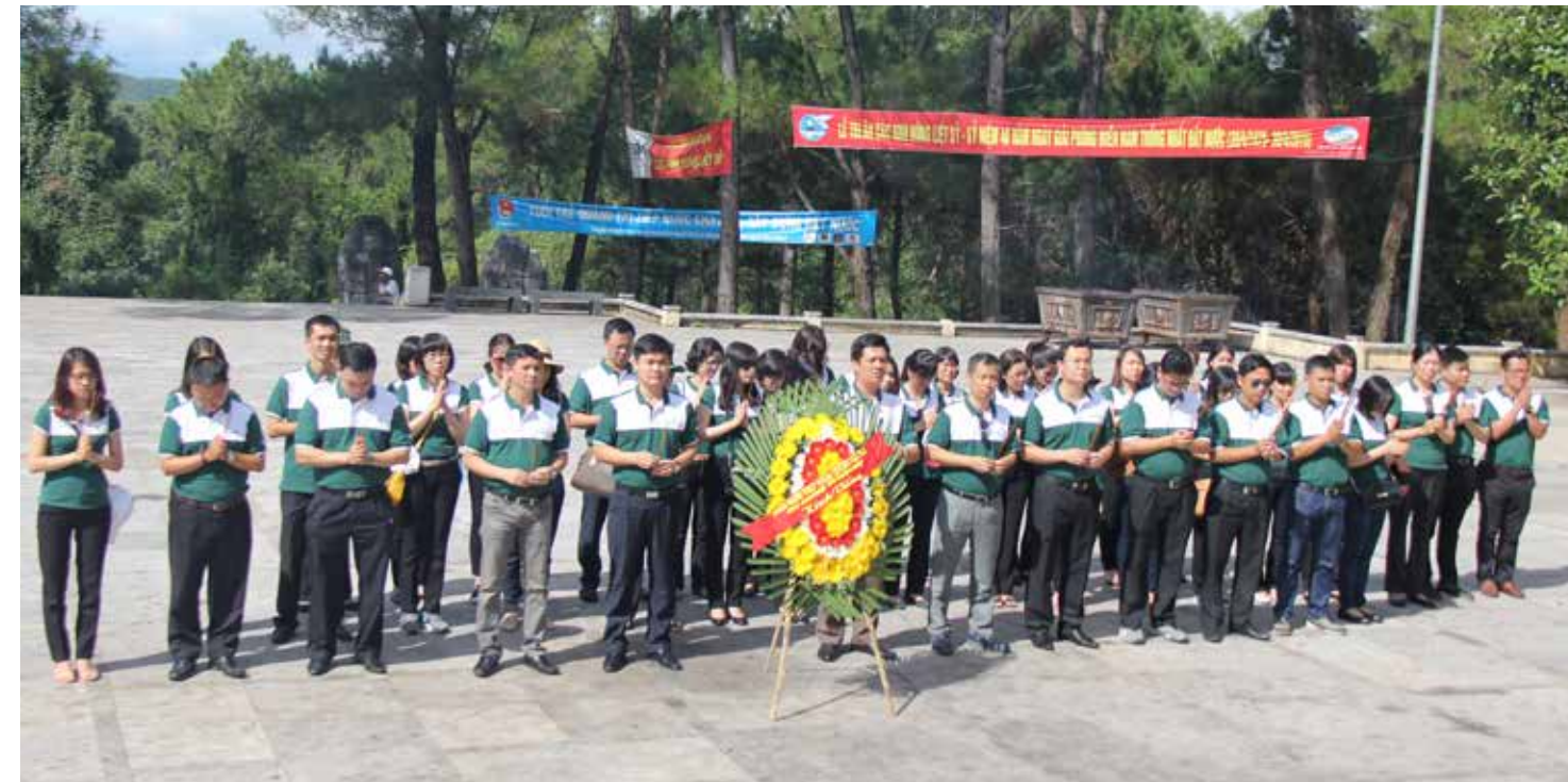
Đoàn đại biểu Đảng bộ Vietcombank Thăng Long thành kính dâng hương tại Nghĩa trang Liệt sỹ Trường Sơn

Đây là lần thứ hai, đoàn chúng tôi viếng thăm Nghĩa trang Trường Sơn, nhưng mỗi lần đứng trước nơi đây, tôi thấy mình thật nhỏ bé trước cả một thế hệ anh hùng đã ra đi để bảo vệ cho nền độc lập của dân tộc. Hơn 10 nghìn người con trai, con gái từ khắp các miền quê Việt Nam, sau chiến tranh lại tụ họp ở đây. Phần lớn những liệt sỹ đã ngã xuống khi mới bước vào tuổi mười tám, đôi mươi, nhiều người còn chưa có người yêu, chưa biết đến nụ hôn đầu. Họ là những anh bộ đội,