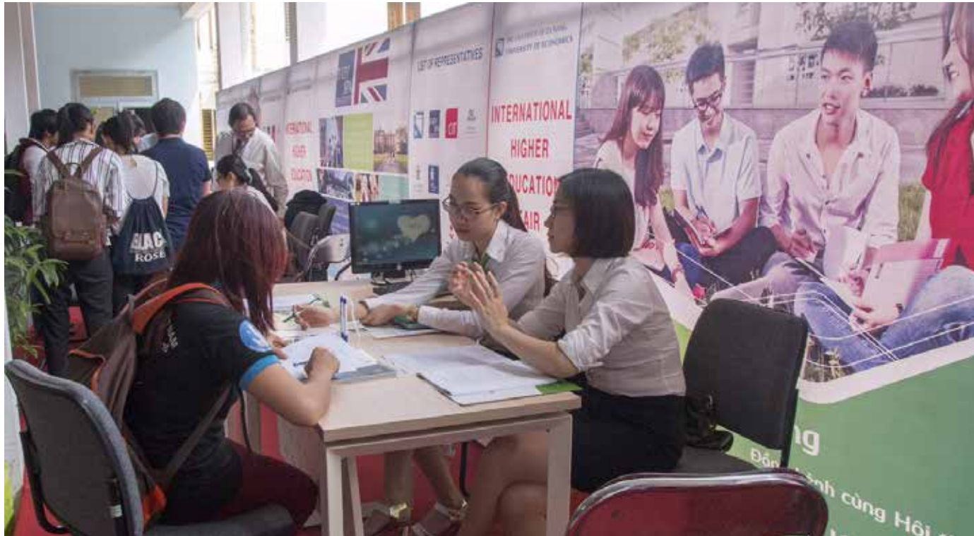
Quầy tư vấn dịch vụ hỗ trợ tài chính du học quốc tế Vietcombank Đà Nẵng