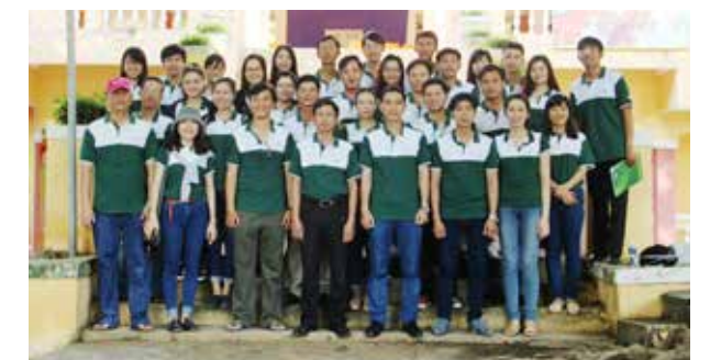
Vietcombank Tây Ninh tại Khu di tích lịch sử văn hóa Núi Bà-Tây Ninh