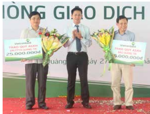
Vietcombank Quảng Trị trao biển tượng trưng số tiền 50 triệu đồng cho Báo Quảng Trị và Đài PT-TH Quảng Trị

Đây là PGD thứ hai được khai trương trong tháng 10/2015 (ngày 15/10/2015, Vietcombank Quảng Trị đã khai trương PGD Vĩnh Linh tại địa chỉ 159 Lê Duẩn, thị trấn Hồ Xá, huyện Vĩnh Linh) và là điểm giao dịch thứ 4 của Vietcombank Quảng Trị. Trong những năm qua phát huy lợi thế của một Ngân hàng thương mại hàng đầu, Vietcombank Quảng Trị đã khẳng định vị thế, phát triển bền vững, đóng góp tích cực và hiệu