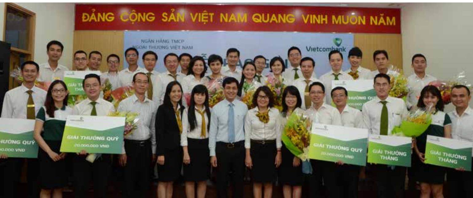
Các lãnh đạo và cá nhân đoạt giải