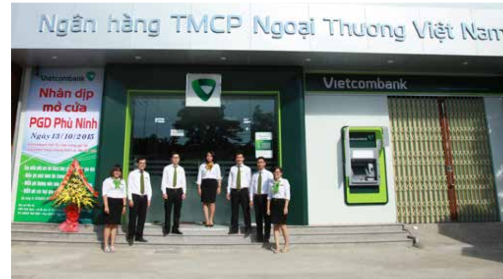
Phòng giao dịch Phù Ninh