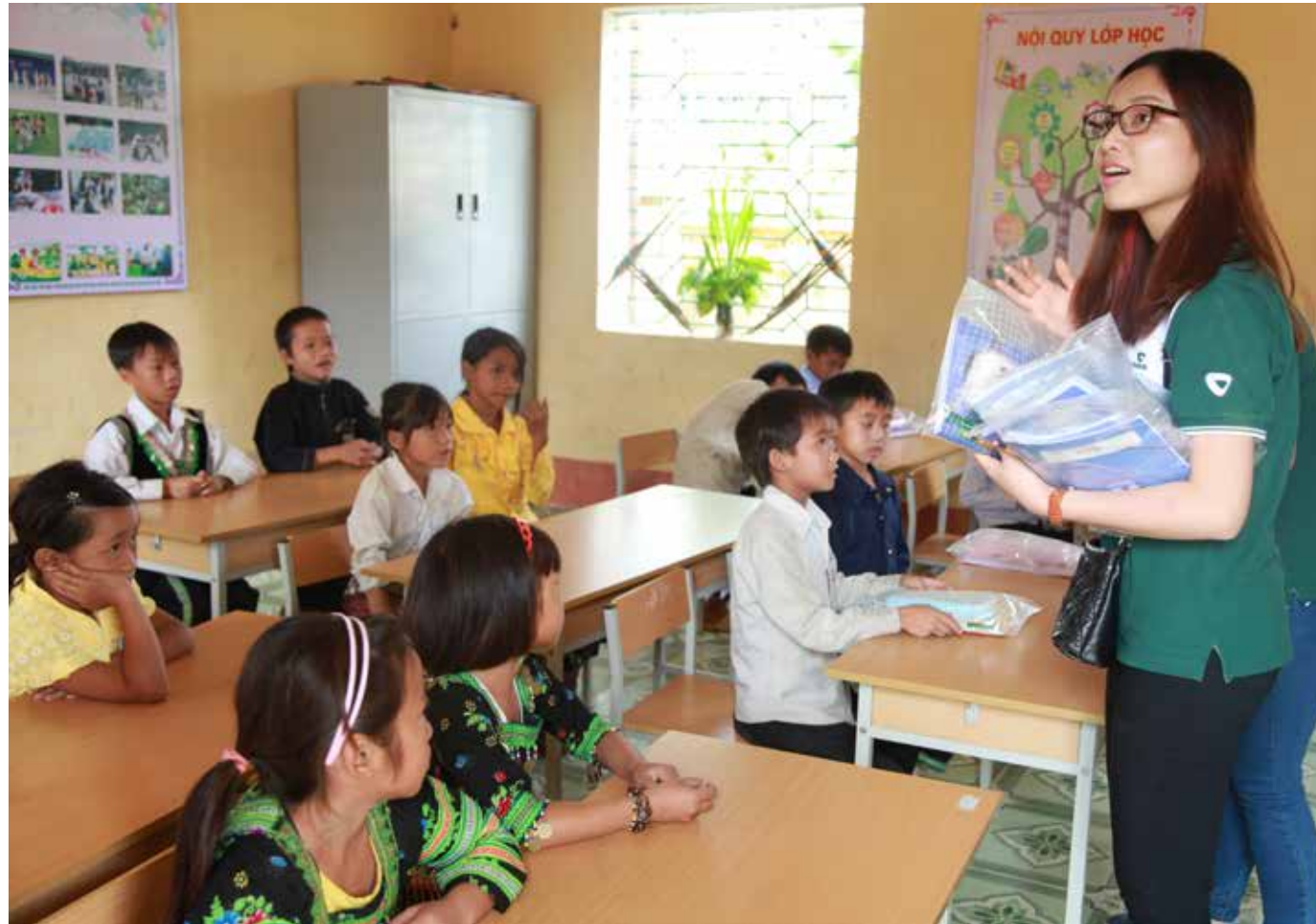
Các đoàn viên thanh niên đang trao quà cho các em học sinh Trường Thu Cúc 2 – cơ sở bản Mỹ Á, Tân Sơn, Phú Thọ

Sau hơn 2 tháng vận động quyên góp và chuẩn bị, 21 đoàn viên thanh niên Vietcombank của Trụ sở chính phối hợp cùng Đoàn TN Vietcombank Việt Trì đã lên đường mang yêu thương đến với các em học sinh huyện Tân Sơn và Thanh Sơn, tỉnh Phú Thọ.