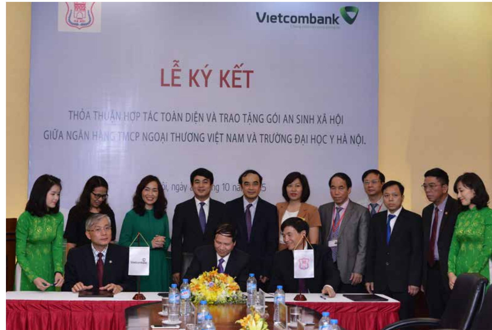
Lễ ký kết thỏa thuận hợp tác toàn diện giữa Vietcombank Hoàn Kiếm và Trường ĐHYHN

Từ thỏa thuận được ký kết, Vietcombank và Trường ĐHYHN sẽ thực hiện sử dụng nhiều dịch vụ của nhau trên cơ sở cùng hợp tác và cung cấp các sản phẩm dịch vụ hiện đại đa tiện ích tốt nhất cho nhau và phục vụ cộng đồng. □