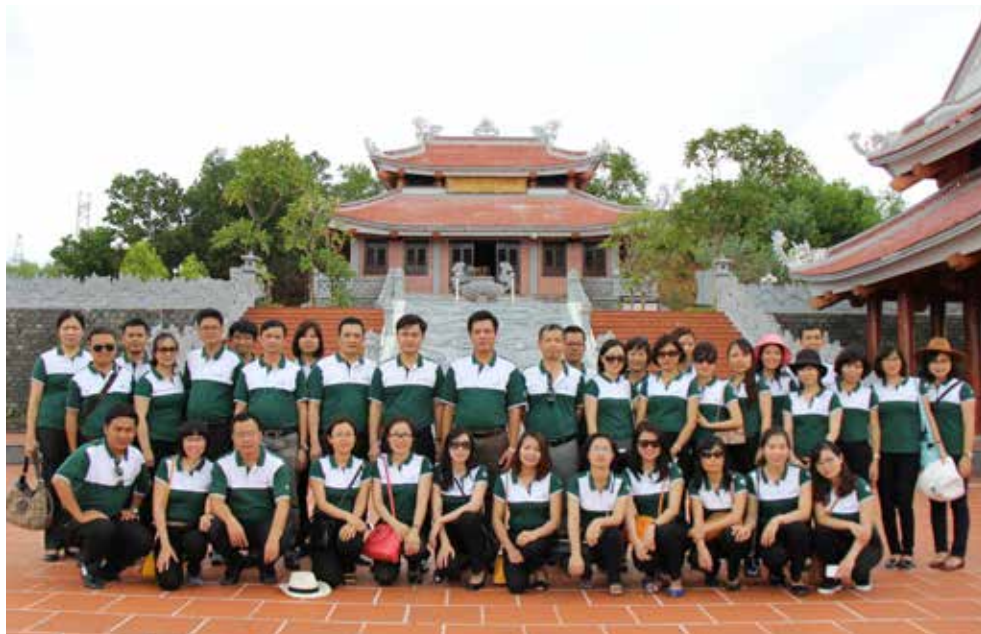
Đoàn đại biểu Đảng bộ Vietcombank Thăng Long chụp ảnh kỷ niệm tại Đền Tưởng niệm liệt sỹ Bến phà Long Đại

hậu phương/ Nơi ấy ngã ba chiến trường/ Nơi một tấm ván phà mấy trăm vết đạn/ Nơi ngọn hải đăng trong gió gào vẩn sáng/ Nơi mở đường đưa máu chảy về tim/ Nơi