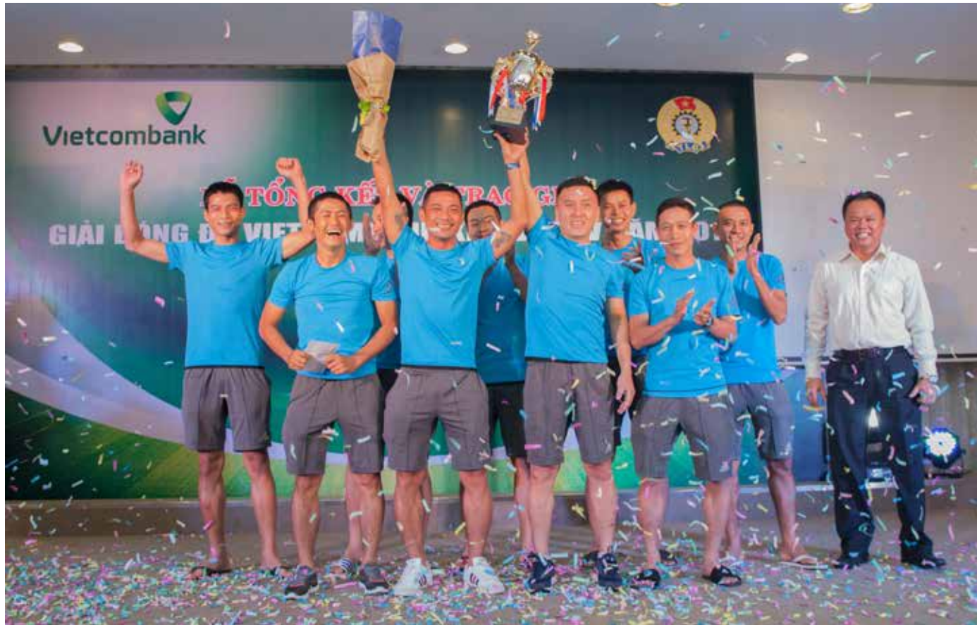
Vietcombank Đà Nẵng nhận Cúp Vô địch