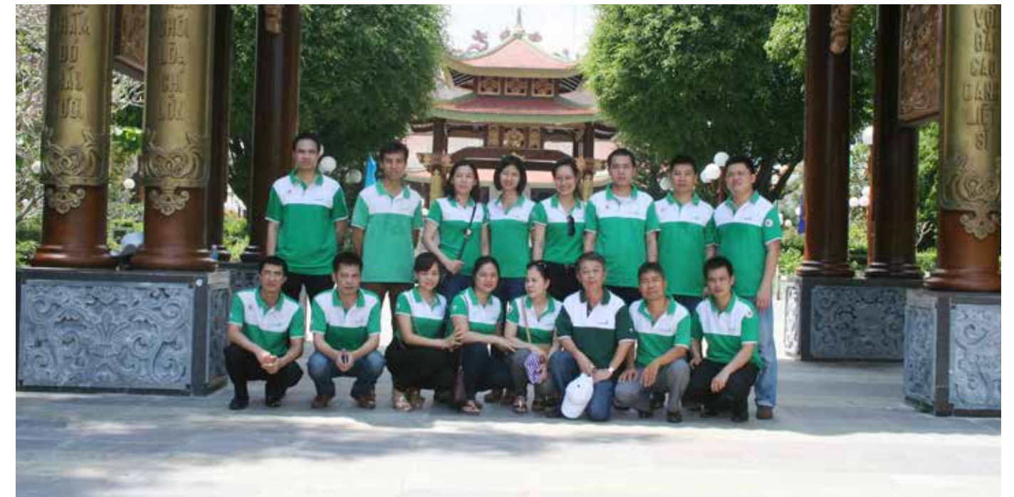
Đảng bộ Vietcombank Hưng Yên thăm Đền tưởng niệm liệt sĩ Bến Dược

Hành trình “Về nguồn” là một hoạt động có ý nghĩa thiết thực với tất cả các thành viên trong đoàn. Qua chuyến đi này, các thành viên trong đoàn đã hiểu biết hơn về Địa đạo Củ Chi, hiểu hơn về sự khốc liệt của cuộc chiến tranh, sự gian khổ, mất mát, hy sinh to lớn của dân tộc ta. Qua đó, càng khâm phục sự thông minh, sáng tạo của nhân dân ta trong chiến tranh. Ôn lại những truyền thống vẻ vang đó của dân tộc cũng chính là rèn luyện cho mỗi đảng viên tinh thần cách mạng, giáo dục tư tưởng chính trị. Mỗi cán bộ, đảng viên đều như cháy thêm lòng nhiệt huyết dân tộc, nguyện đem hết sức mình vào công cuộc xây dựng quê hương đất nước, xứng đáng với sự hy sinh của cha ông ta, xứng đáng với truyền thống anh hùng của dân tộc Việt Nam. Kết thúc cuộc hành trình nhưng vẫn có một ngọn lửa luôn cháy lên trong lòng chúng tôi – Ngọn lửa của lòng nhiệt huyết và tự hào dân tộc. □