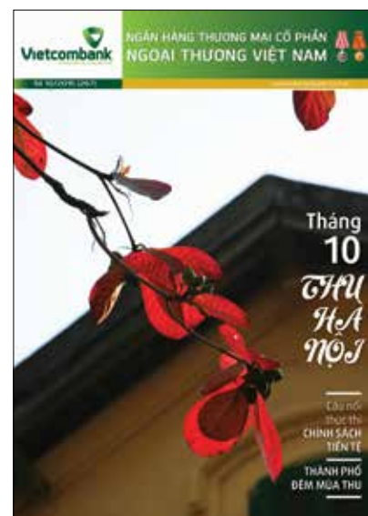
BẢN TIN CỦA NGÂN HÀNG TMCP NGOẠI THƯƠNG VIỆT NAM SỐ 10/2015 (267)