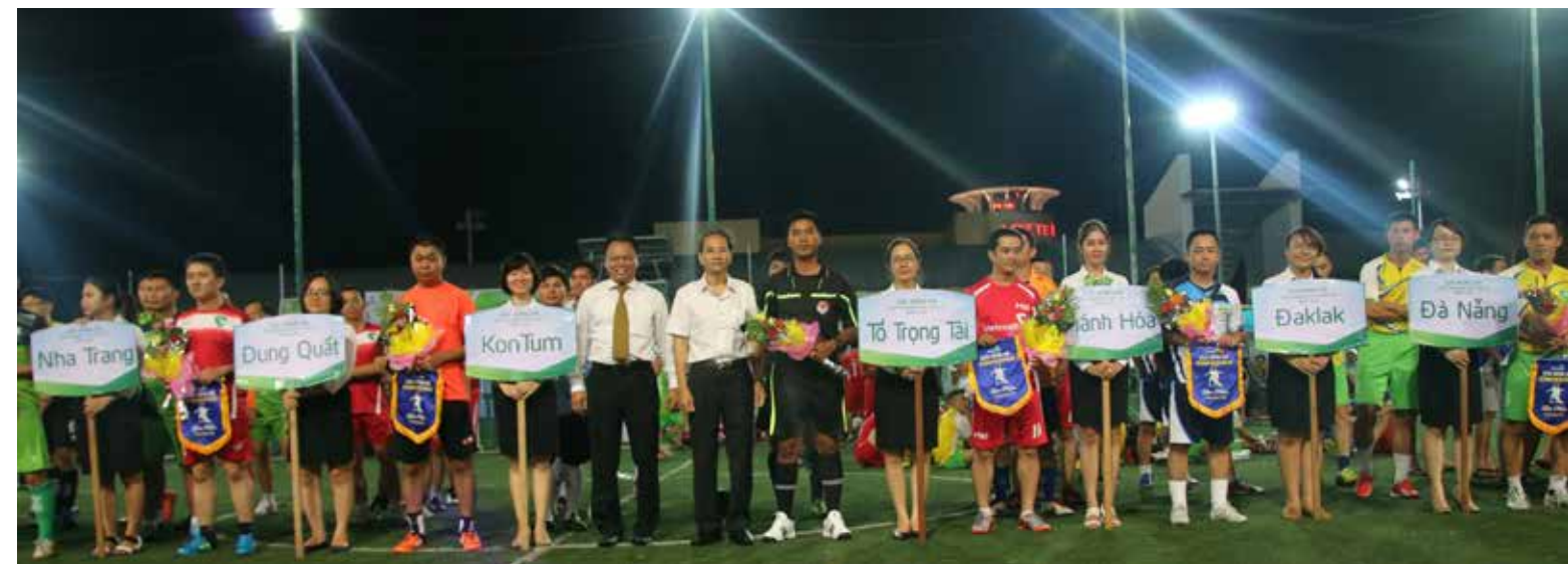
Lễ Khai mạc